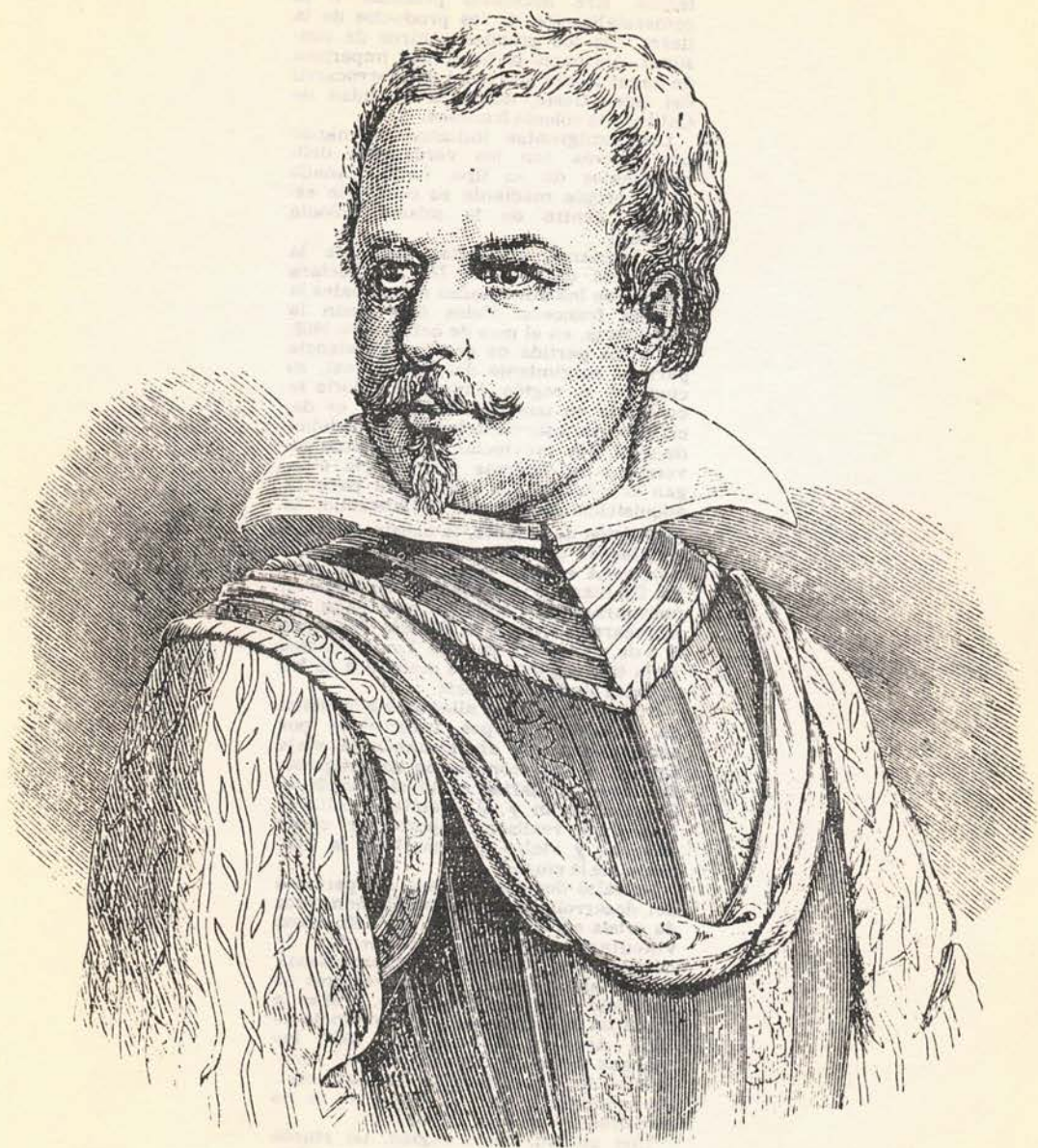
FRANCISCO DE VILLAGRA, primer blanco hispánico descubridor de las tierras del Diamante, en 1551