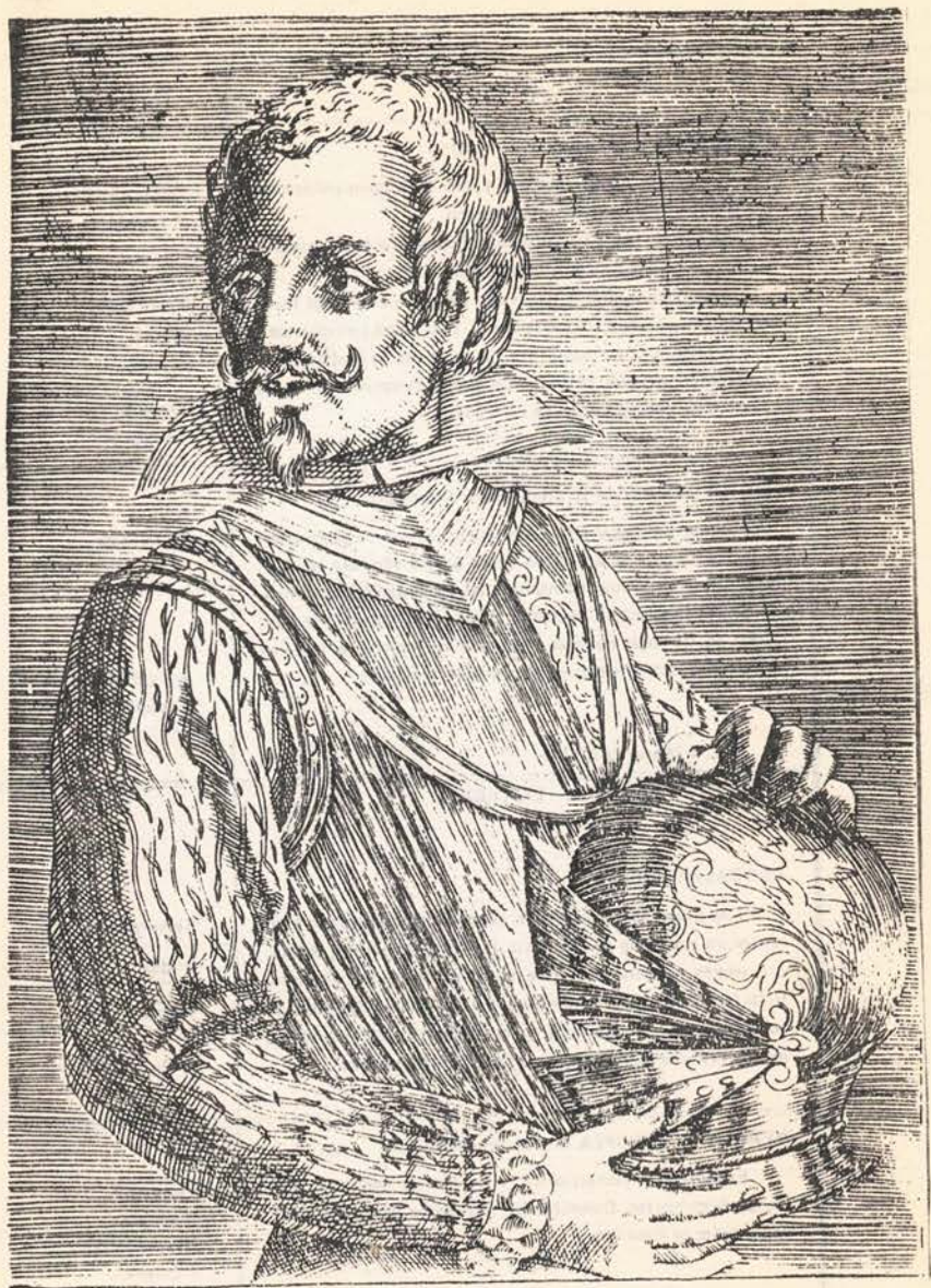
GOVERNADOR FRAN co DE VILLAGRA

Ilustración del Capitán Francisco de Villagra, tomado del libro del Cronista Alfonso de Ovalle, 1646. Histórica Relación del Reino de Chile. Roma