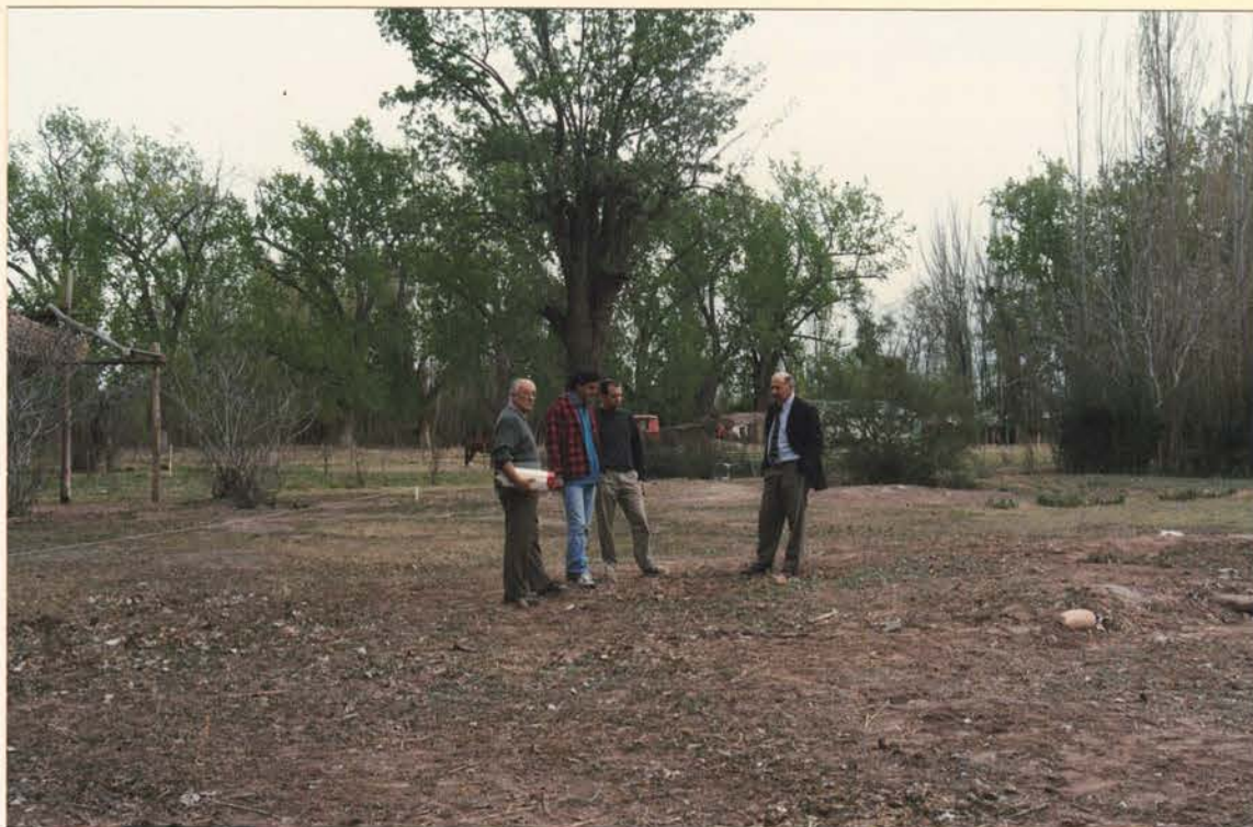
FOTO5. Vista tomadas de diferemntes ángulos del sitio donde se contruyera en 1865 de la Comandancia externa del Fuerte Histórico San Rafael del Diamante.