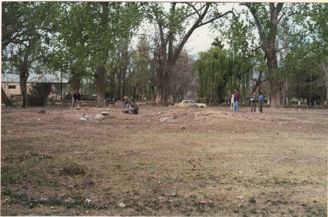
FOTO 4. Vista tomadas de diferentes ángulos del sitio donde se contruyera en 1865 de la Comandancia externa del Fuerte Histórico San Rafael del Diamante.