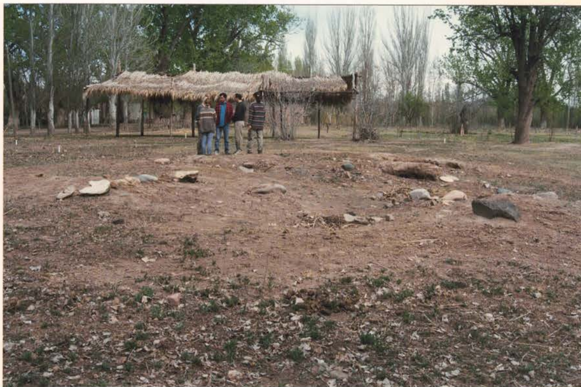
FOTO6. Vista tomadas de diferemntes ángulos del sitio donde se contruyera en 1865 de la Comandancia externa del Fuerte Histórico San Rafael del Diamante.