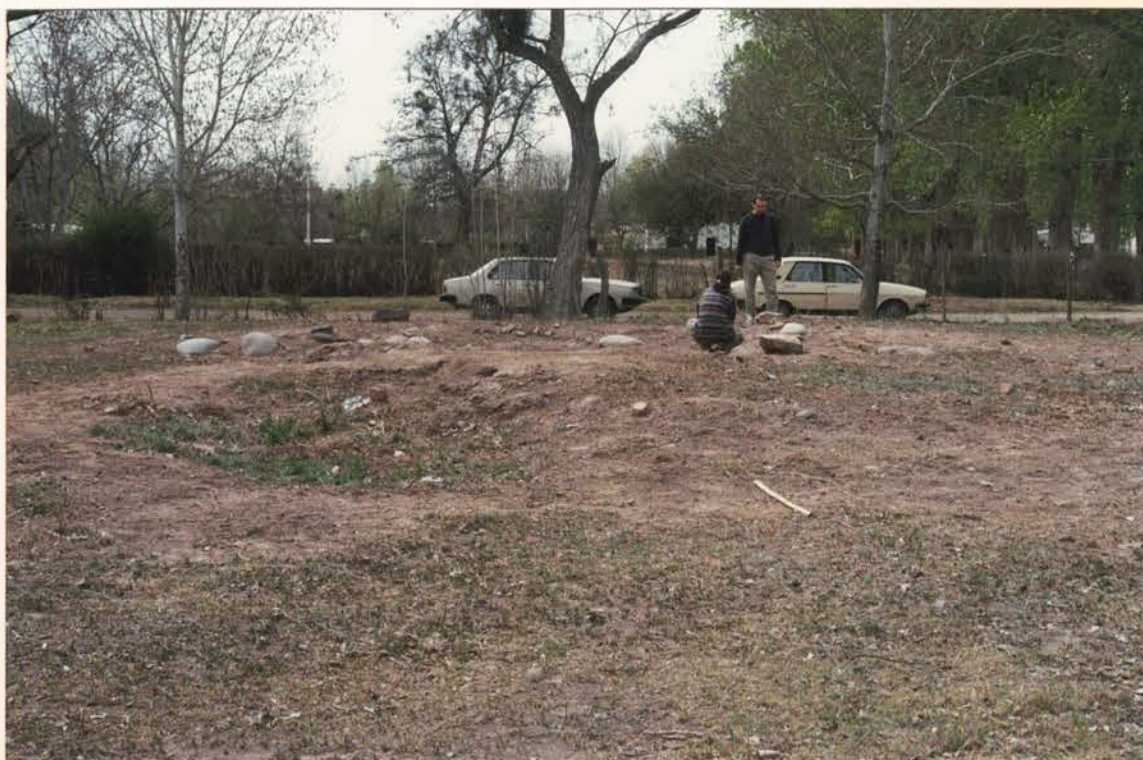
FOTO 2. Depresión y promontorio que albergan las ruinas y cimientos de la Comandancia externa del Fuerte Histórico San Rafael del Diamante.