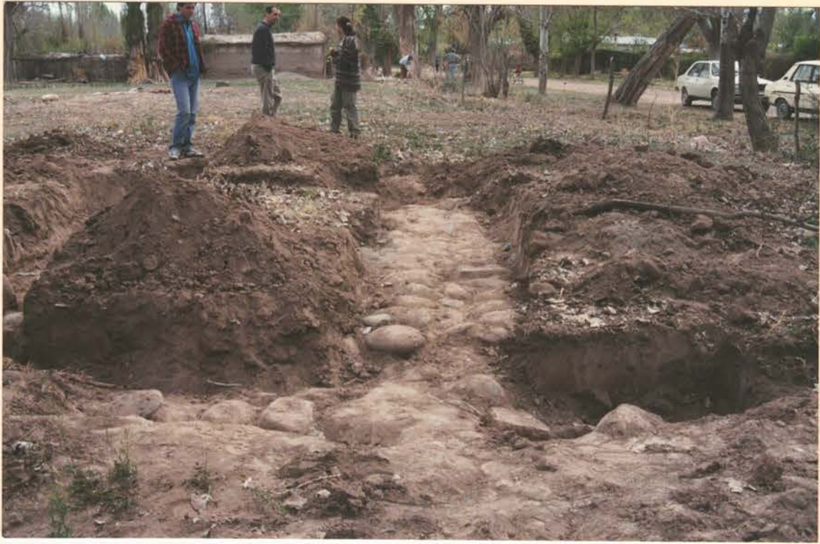
FOTO 9. Base de los cimientos de antiguas construcciones y promontorios de sedimentos removidos por orden del Sr. Calderón.