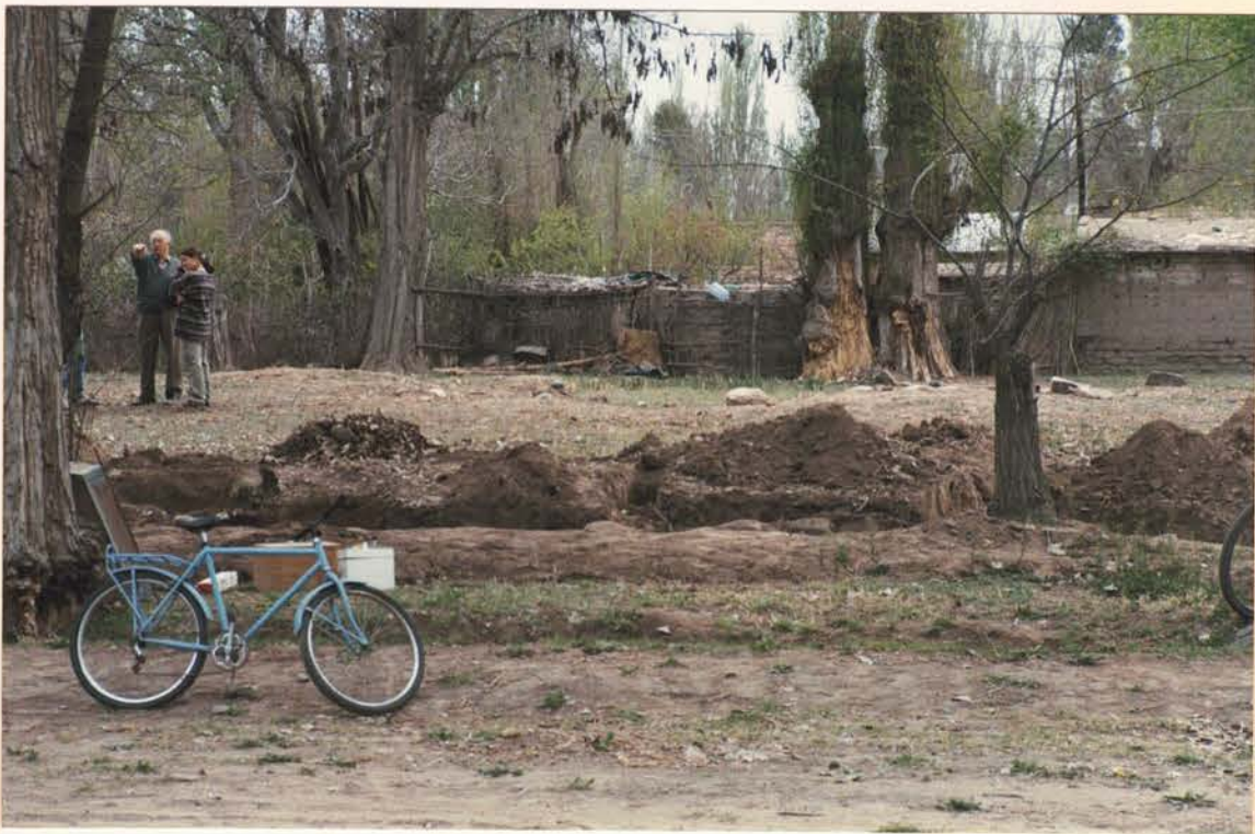
FOTO 10. Otra vista de los mismos trabajos en el sitio.