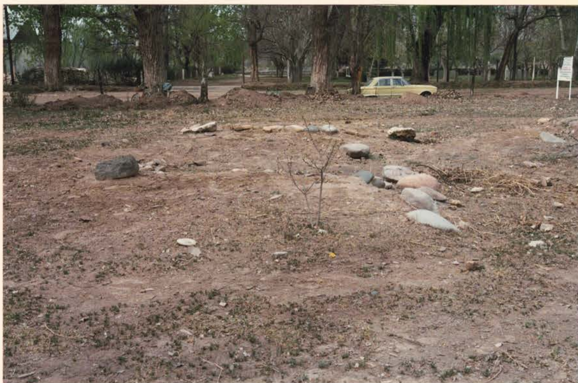
FOTO 1. Vista del predio de la Comandancia del Fuerte de San Rafael, situado entre las Calles Avda. Mitre y Colón de la Villa 25 de Mayo. Construido por el Coronel Segovia en el año 1865.