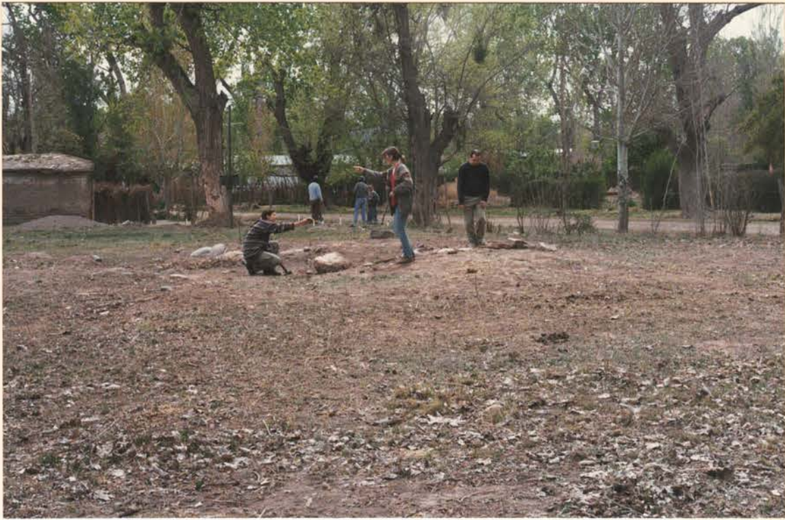
FOTO 3. Promontorio principal de las mismas ruinas de la Comandancia.